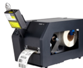
Online Data Validator (ODV)